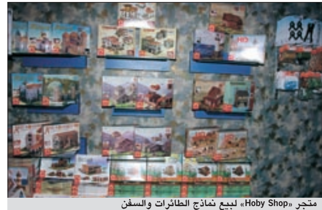
متجر «Hobby Shop» لبيع نماذج الطائرات والسفن