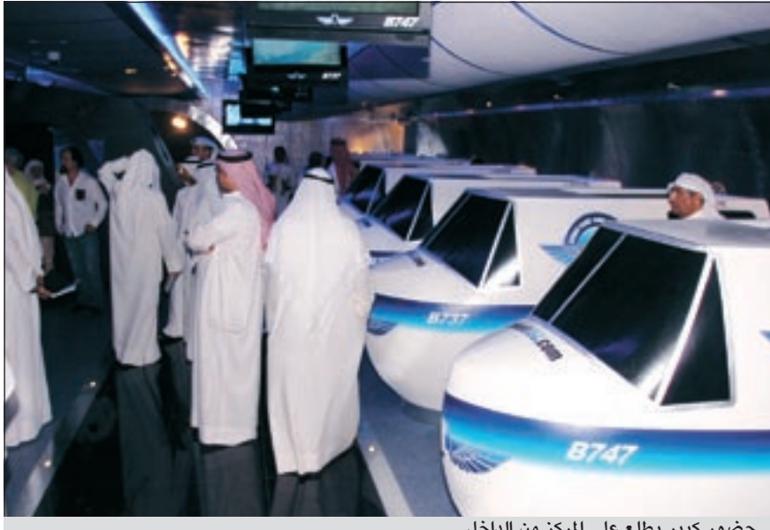
حضور كبير يطلع على المركز من الداخل