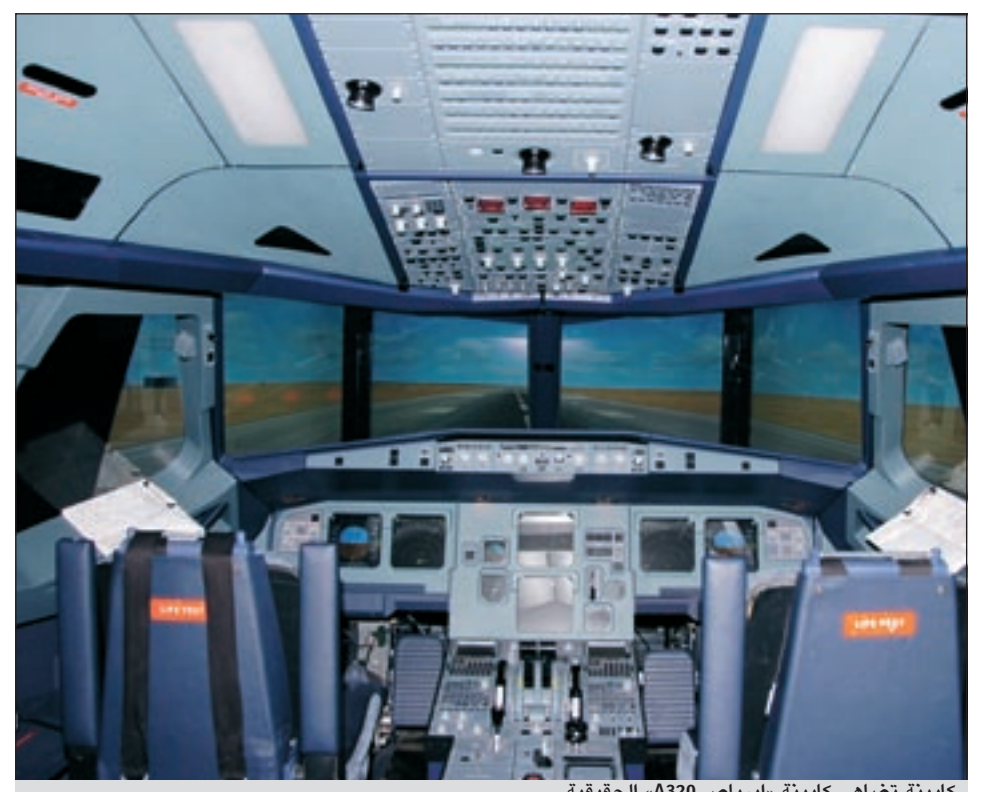
كابينة تضاهاي كابينة «إيرباص A320» الحقيقية